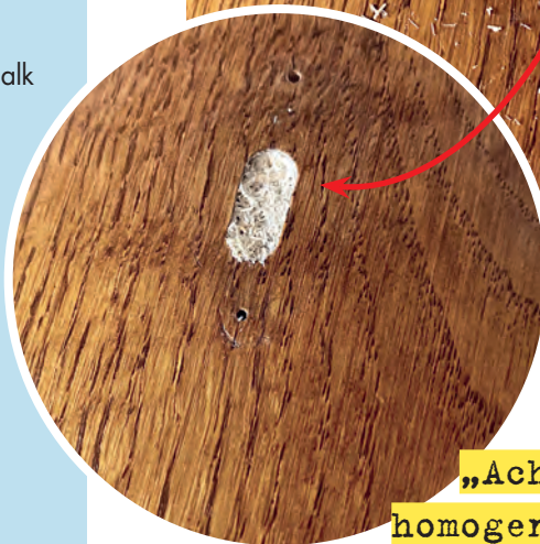
Daggi Dethlefsen, Upcycling- Expertin